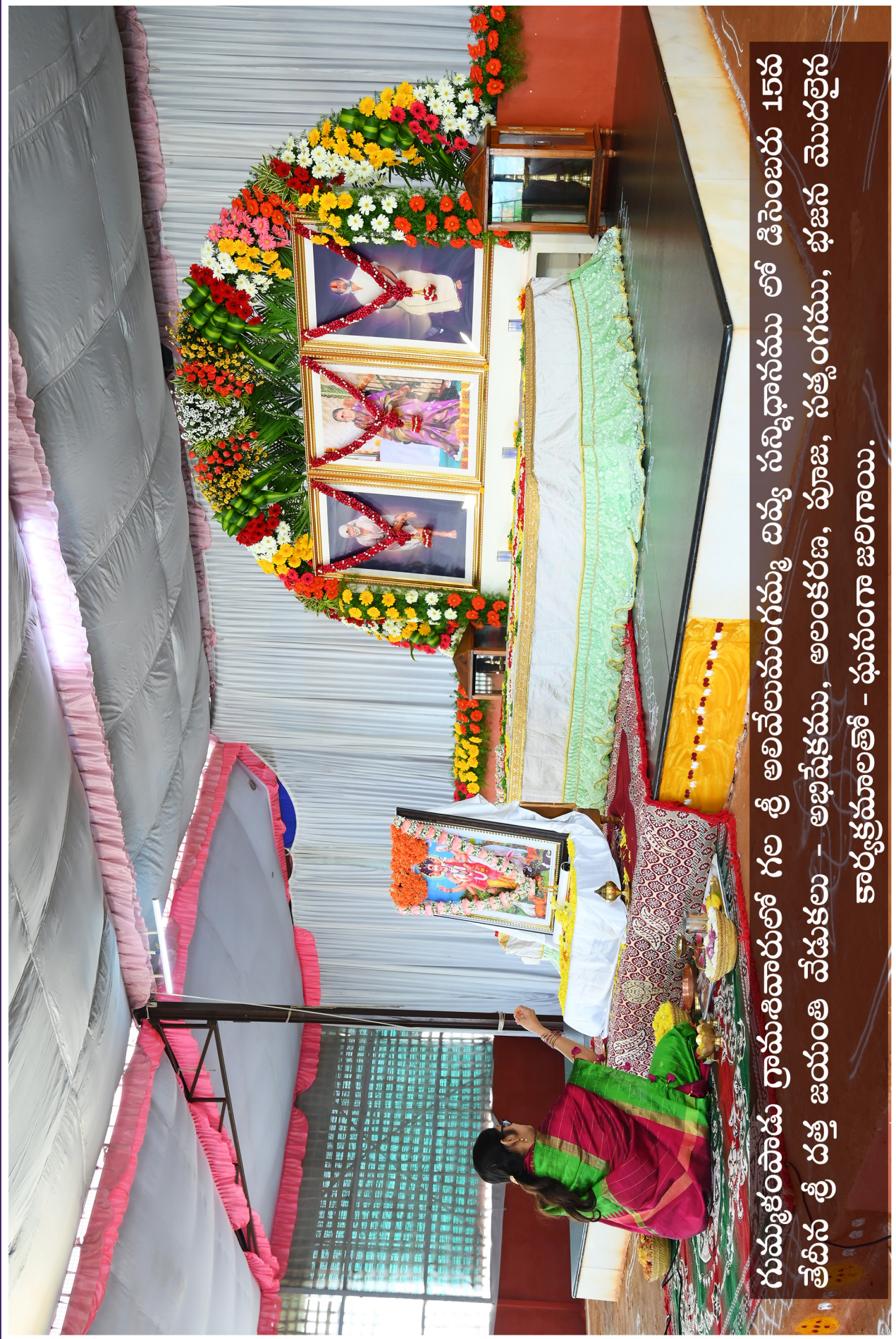
గుమ్మళంపాడు గ్రామశివారులో గల శ్రీ అలివేలుమంగమ్మ దివ్య సన్నిధానము లో డిసెంబరు 15వ తేదీన శ్రీ దత్త జయంతి వేడుకలు - అభిషేకము, అలంకరణ, పూజ, సత్సంగము, భజన మొదలైన కార్యక్రమాలతో - ఘనంగా జరిగాయి.