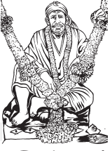
జూలై సంచిక తరువాయి