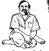
- శ్రీమతి శ్రీదేవి